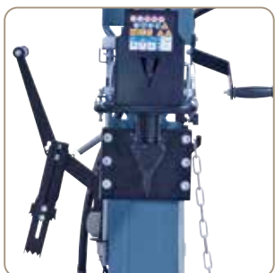
Lucrat în siguranță datorită operării cu două mâini, viteza de înaintare la alegere rapidă sau lentă.