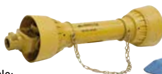
Accesorii opționale: Articulator ax