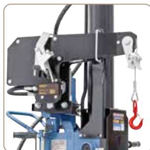
Disponibil opțional: Trolie hidraulic cu cablu