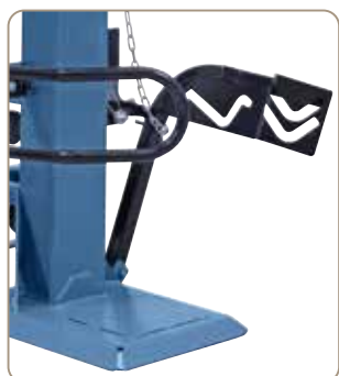
Pentru alinierea buștenilor grei este echipată în fabricație de serie cu cricul mecanic de bușteni