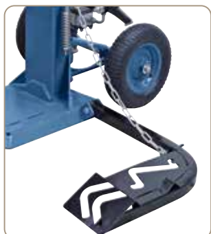
Pentru alinierea buștenilor grei este echipată în fabricație de serie cu cricul mecanic de bușteni