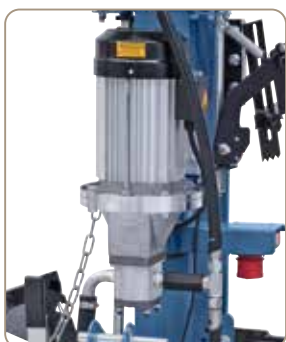
Modelele ZE cu motor de acționare din aluminiu de putere mare și pompă hidraulică de înaltă calitate.