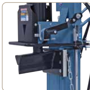
Wykonane z tworzywa przewodnice niezwykle odporne na ścieranie