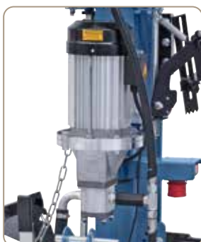
Modele ZE w wyposażeniu standardowym są oferowane z aluminiowym silnikiem napędowym o dużej mocy i wydajną pompą hydrauliczną