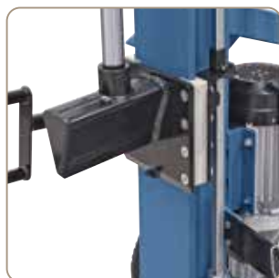
Wykonane z tworzywa prowadnice niezwykle odporne na ścieranie