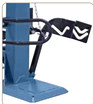
W wyposażeniu standardowym z mechanicznym podnośnikiem do ustawiania dużych i ciężkich kłód