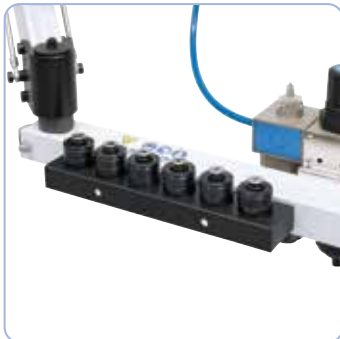
Pikaistukan tilaa säästävä säilytys suoraan koneen rungossa (TM 12 P / TM 16 P).