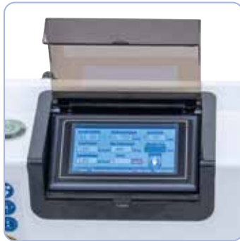
Mukavaa työskentelyä: kierteen koon, nousun, kierrosluvun ja poraussyvyyden säätö suoraan integroidusta kosketusnäytöstä