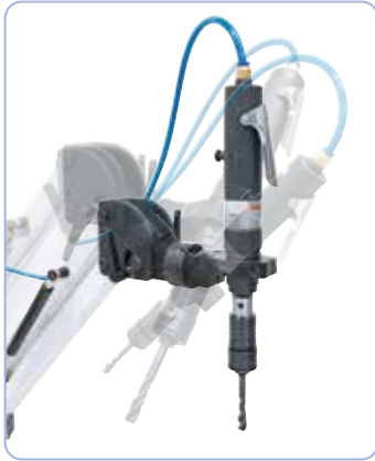
Käännettävä moottoriyksikkö kierteiden leikkaukseen vaaka-, pysty- ja poikittaissuunnassa.