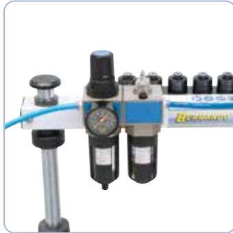
Huoltoyksikkö ja paineensäädin