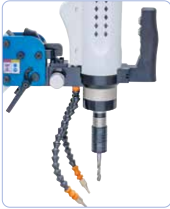
Vakiovarusteena mikro-suihkutusjärjestelmä ja puhalluslaite.