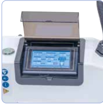
Mukavaa työskentelyä: kierteen koon, nousun, kierrosluvun ja poraussyvyyden säätö suoraan integroidusta kosketusnäytöstä