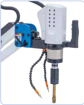
Vakiovarusteena mikro-suihkutusjärjestelmä ja puhalluslaite.