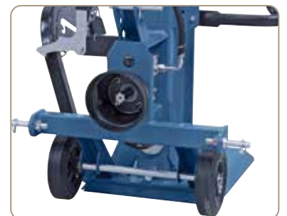
Serienmäßig mit Dreipunkthalterung nach Kat. I/II und Aufnahmestifte.