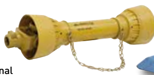
Gelenkwelle optional erhältlich