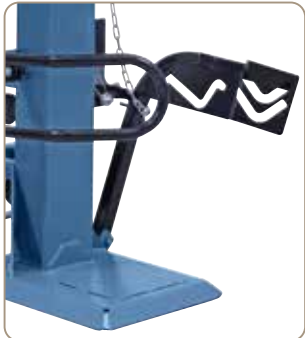
Udstyret som standard med en mekanisk stammeløfter til opstilling af tunge træstammer.