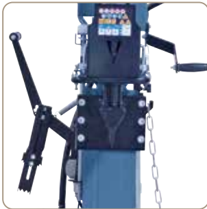
Sikkert arbejde takket være tohåndsbetjent, fremadgående hastighed - hurtig eller langsom.