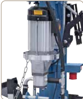
ZE-modellerne er med kraftfuldt elektro motor og høj kvalitets hydraulisk pumpe.