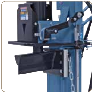
Stor kile med stabil, holdbar kunststofføring.