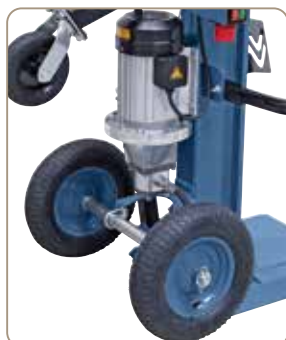
Store gummidæk, der gør det nemt at flytte kløveren (HS 16 E).