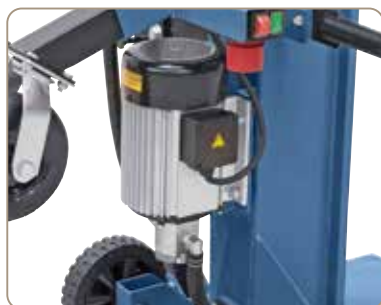
Kraftig elmotor og hydraulikpumpe af høj kvalitet.