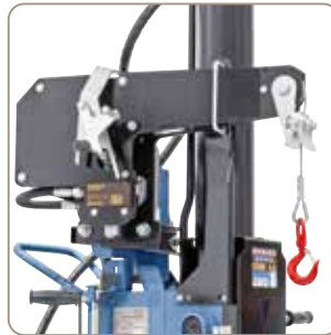
Ekstraudstyr: hydraulisk kabelspil