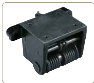
Ideel til bordfræsemaskiner til nem sammenklapning af fremføringen (tilkøb)