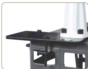
Tilkøb: QH-01 monteringsplade til hurtig og nem fastgørelse (Baby M3 / AF 32)