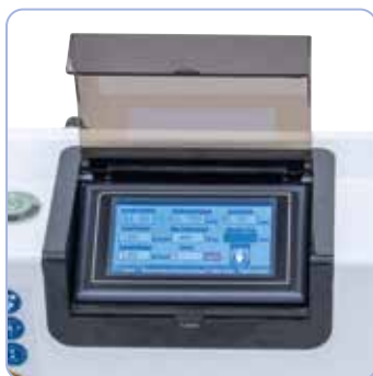
Komfortabelt arbejde: Indstilling af gevindstørrelse, stigning, hastighed og boreddybde direkte via den integrerede berøringsfølsomme skærm