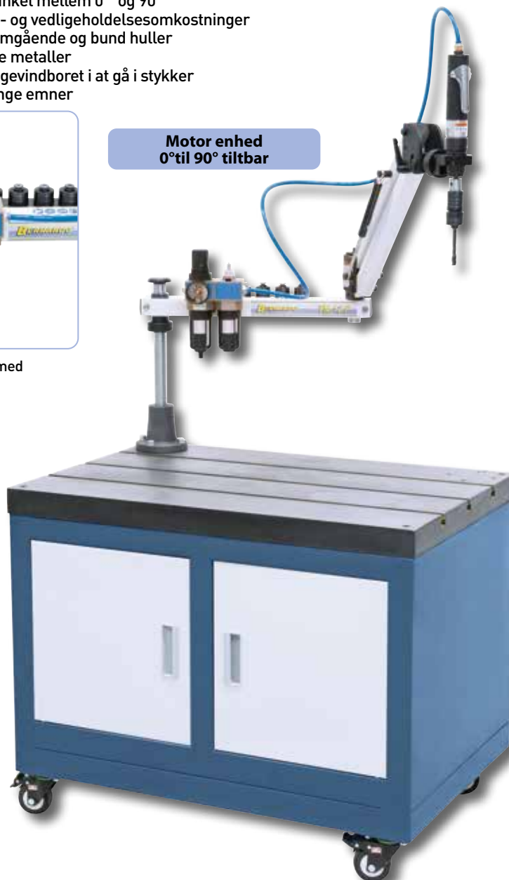
Motor enhed 0° til 90° tiltbar

Pladsbesparende opbevaring af hurtigskiftepatronen direkte på maskinhuset. (TM 12 P / TM 16 P).