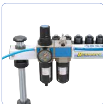
Vedligeholdelsesenhed med trykregulator

Drejelig motorenhed til gevindskæring i vandrette, lodrette og diagonale retninger.